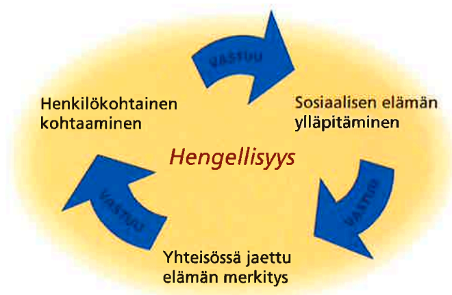
KUVIO 1. Diakonian yhteisöllisyyden rakentumisen elementit.

Keskinäisen huolenpidon rakentuminen seurakuntayhteisössä edellyttää mahdollisuutta kiinnittyä ja liittyä sekä yhteisössä eläviin ihmisiin että yhteiseen merkityskehukseen. Kasvaminen vastuun ja osallisuuden yhteisöksi tapahtuu yhteisössä koetun hyväksynnän ja lähimmäisenrakkauden sanoman sisäistämisen kautta. Diakoniatoiminnassa mukana olemisen ja osallisuuden kautta rakentuu ihmiselle diakoninen merkityskehys, josta käsin tarkasteltuna myös yhteisön ulkopuolelle laajentuva diakoninen elämäntapa ja toiminta on perusteltua. Diakonisen merkityskehysten voidaan nähdä sisältävän sekä yhteisen ymmärryksen elämän