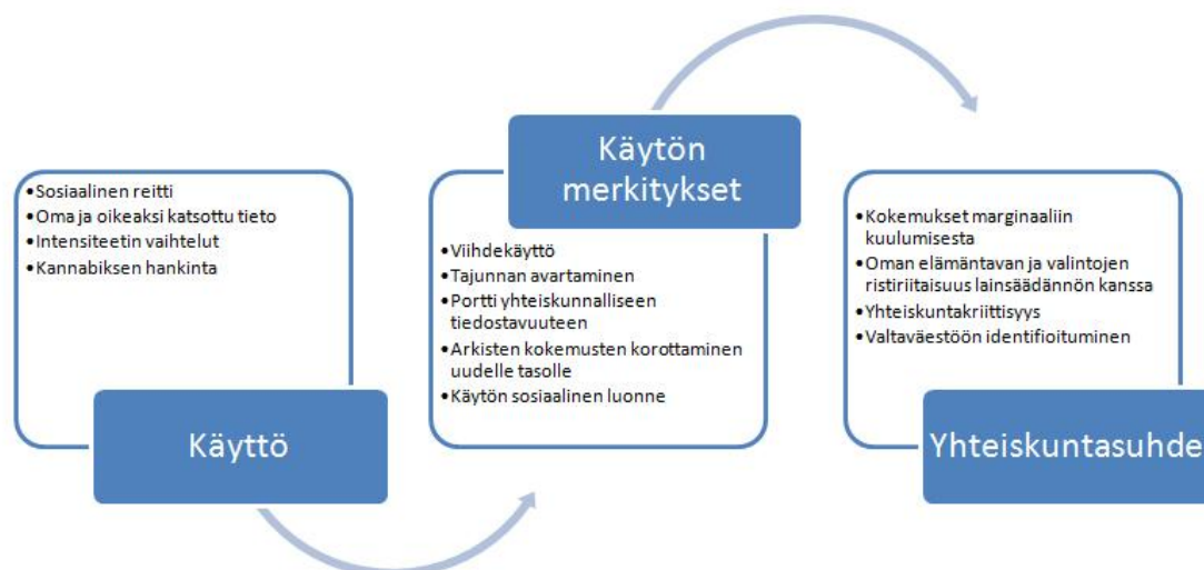
KUVA 1. Yhteenveto tutkimuksen keskeisistä tuloksista