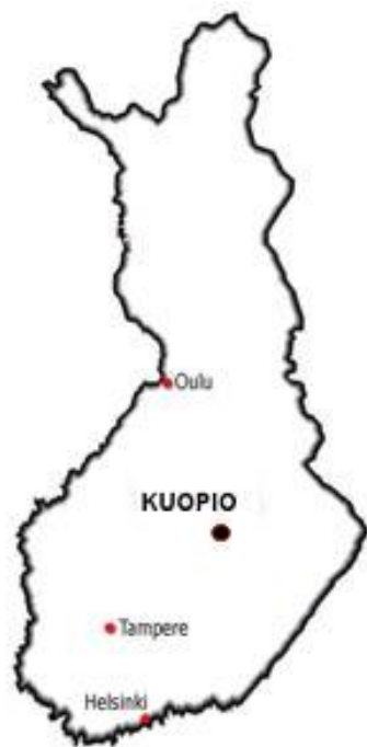
Kartta 1. Kuopion sijainti.

Kuopio on vuonna 1775 perustettu kaupunki ja tällä hetkellä Suomen kahdeksanneksi suurin kaupunki. Kuntaliitosten myötä Kuopion asukasluku on kohonnut jo 111 000:een, ja koko Kuopion vaikutusalueella asukkaita on 600 000. Kaupunki sijaitsee Pohjois-Savon maakunnassa, Kallaveden rannalla. Kuopion pinta-alasta puolet on metsäalueita ja noin kolmasosa vesistöä. Rantaviivaa Kuopiolta löytyy jopa 5442 km. Kuopio onkin tunnettu upeista järvimaisemistaan, rikkaasta luonnostaan sekä vaihtelevista korkeuseroistaan, jotka houkuttelevat turisteja ja asukkaita Savon sydämeen. (Kuopion kaupunki 2015a.)