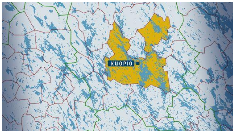
Kartta 2. Kuopio 1.1.2015 alkaen.

Kuopio on yliopistokaupunki ja myös yksi tärkeä osaamiskeskus valtakunnallisesti. Kuopiota voidaankin pitää tärkeänä keskusalueena, jossa osaaminen, tiede ja teknologia ovat kansainvälisestikin merkittäviä. Puu- ja elintarviketeollisuus ovat tärkeimmät teollisuuden alat, sillä ne ovat merkittäviä vientialoja Kuopiossa. Myös matkailulla on tärkeä rooli, joka on voimistunut