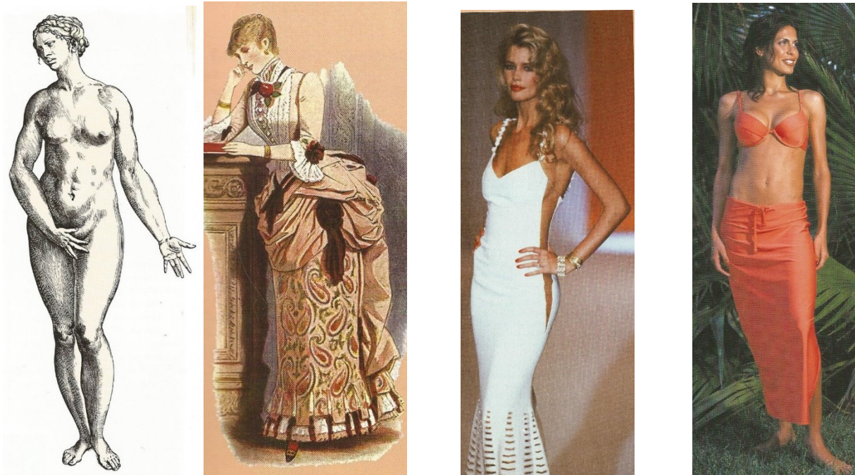
KUVA 1. Naisvartaloihanteita 1500 –, 1880 –, 1990 – ja 2000 – luvulla (Utrio 2001, 12, 17, 47, 95)

1500 – luvulta, jolloin ihailtiin tervettä naisvartaloa, jossa oli rehevyyttä. Tuolloin ajateltiin, että kauniissa naisessa sekä ruumis että sielu ovat kauniita ja sopuossuussa keskenään. Keskiajalla, kuten myös 1500 -luvullakin naisihanteeseen kuului myös mittojen tasapaino: kasvojen ja raajojen mittasuhteiden täytyi sopia toisiinsa. (Utrio 2001, 12 – 14.) 1880 – luvulla (kuva 1.) ihailtiin pientä ylävartaloa ja runsasta alavartaloa, jota korostettiin runsailla ja täytteitä sisältävällä hameilla ja mekoilla. Pituutta koitettiin saada lisää myös hiustyylillä ja -asusteilla. Naisessa arvostettiin tuolloin myös kasvojen kauneutta, ryhdikästä olemusta ja hyvää käytöstä. (Utrio 2001, 46 – 48, 92, 103.)