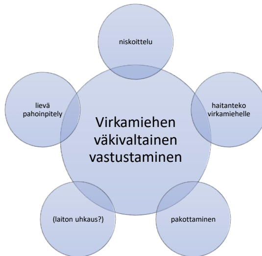
Kuvio 2. Virkamiehen väkivaltaiseen vastustamiseen sisältyvät rikossäännökset

Kuten olen esittänyt, laittoman uhkauksen sisältyminen virkamiehen väkivaltaiseen vastustamiseen ei ole yksioikoista. Oikeuskirjallisuudessa ja oikeuskäytännössä esitetyt kannat poikkeavat toisistaan. Nykyisen oikeuskäytännön linjauksen perusteella alioikeuksien tulee käytännössä noudattaa korkeimman oikeuden oikeusohjetta ja sisällyttää laiton uhkaus virkamiehen väkivaltaiseen vastustamiseen. Muiden alla olevien rikosnimikkeiden soveltaminen virkamiehen väkivaltaiseen vastustamisen rinnalla ei liene aiheuttavan samanlaista epäselvyyttä ja eriävyyttä. Selvää on, että virkamiehen väkivaltainen vastustaminen pyrkii suojaamaan virkamiehiä ”perusmuotoiselta” väkivallalta. Kaikenlainen tavanomaista ”perusvääntöä” vakavampi väkivalta ja sen uhka johtavat rinnakkaisen säännöksen samanaikaiseen soveltamiseen. Kuitenkaan murhaa koskeva säännös ei ole välttämättä rinnakkainen RL 16:1 kanssa, koska murhasäännöksessä on otettu erikseen huomioon virkamiehen tappaminen. Tällöin murhasäännös kattaisi virkamiehen väkivaltaiseen vastustamiseen, eikä siitä tuomittaisi erikseen. Jos virkamies ei ole kuitenkaan kuollut, voi murhan yritys ja virkamiehen väkivaltainen vastustaminen tulla kyseeseen.