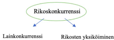
Kuvio 1. Rikoskonkurrensi