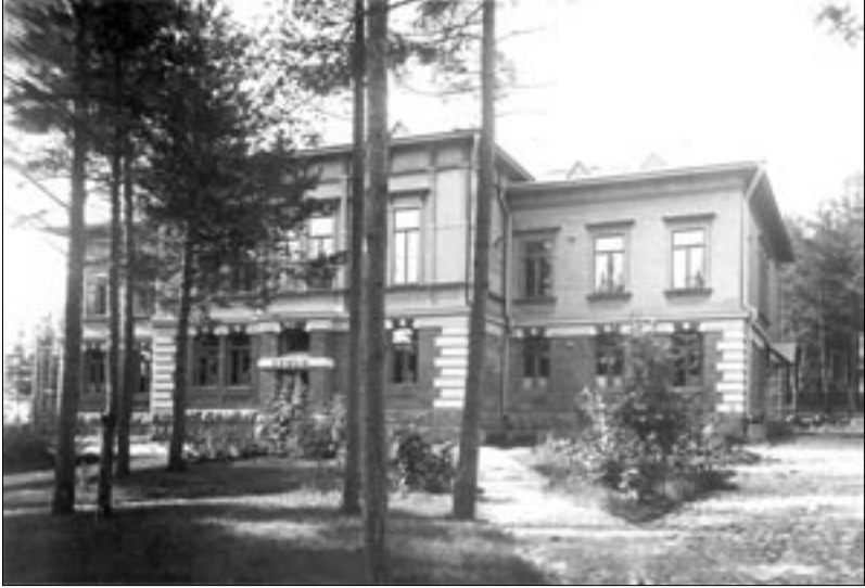
Kuopion sokeainkoulu vuonna 1909.

tona ja opettajien tekeminä lahjoituksina. Näin saatiin koululle Thulen suosittelemat urut, joissa oli kuusi äänikertaa. 168