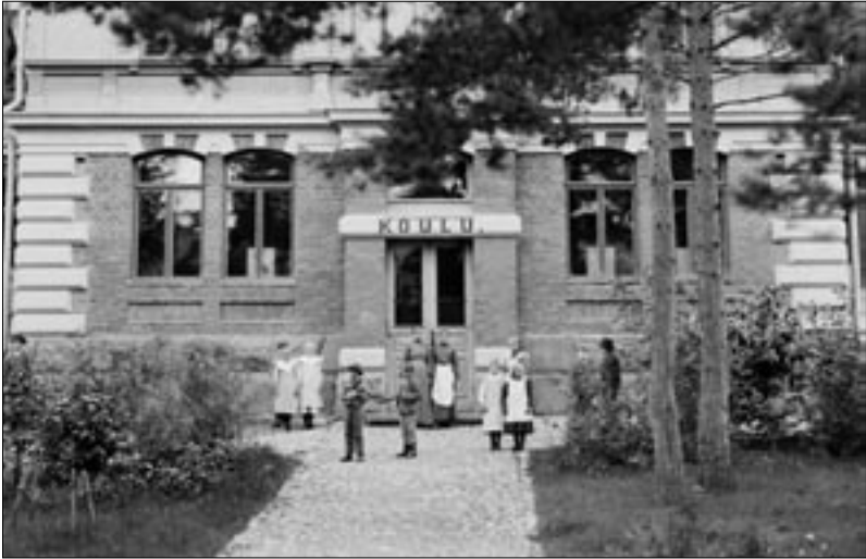
Kuopion sokeainkoulun oppilaita ja opettajia pihalla vuonna 1909.