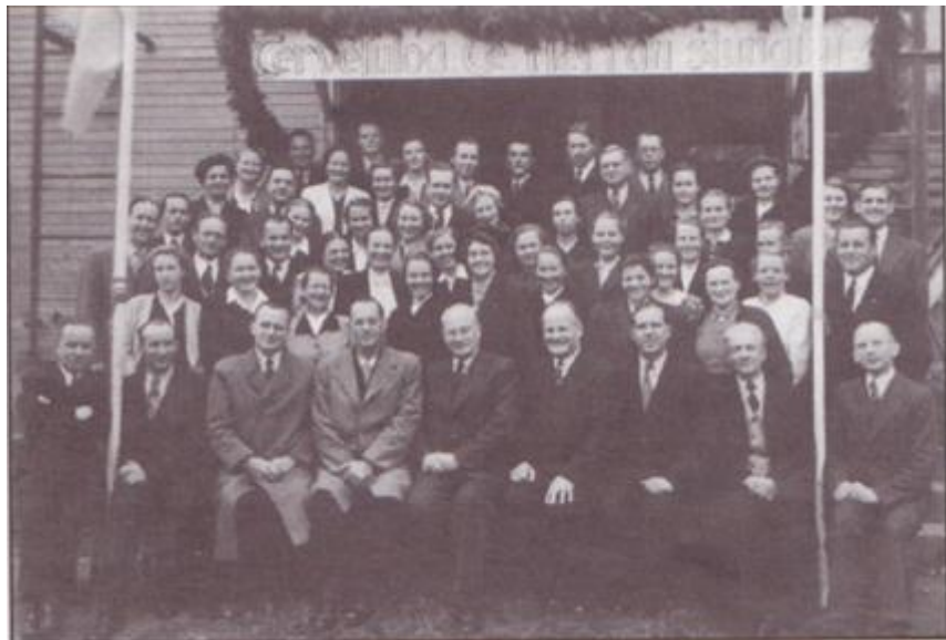
Työntekijöiden valtakunnalliset koulutuspäivät pidettiin Joensuun Ollinlinnassa 20.9.1949.

Vuonna 1949 seurakunnan keskuudessa käytiin yleistä keskustelua, joka liittyi oman kirkkorakennuksen saamiseen Joensuuhun. Ollinlinnan vuokratilat olivat vain väliaikainen ratkaisu ja tavoitteena oli oma kirkkorakennus. Kokouksia pidettiin myös Mutalassa nuorisoseuran talolla. Syyskuussa Ollinlinnassa järjestettiin adventtikirkon valtakunnalliset työntekijäkoulutuspäivät, joilla olivat läsnä kaikki työntekijät Suomesta ja lisäksi vierailijoita Yhdysvalloista, Ruotsista ja Viirosta. Adventistit tunsivat ylpeyttä siitä, että olivat saaneet järjestettyä tällaisen tapahtuman Joensuuhun. Työntekijäpäivät näkyivät katukuvassa, ja paikalliset sanomalehdetkin kirjoittivat tapahtumasta pari kertaa. 71