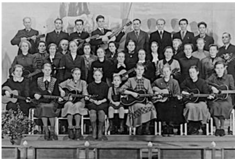
Kitarakuoro vuonna 1953.

Maaliskuun puolessavälissä meillä oli jälleen suuret juhlat, ja silloin saimme pitää vieraanamme rakkaat Elsa ja Aino siskot ja sisar Mäkelän. Juhlat kestivät kolme päivää, perjantain, sapatin ja sunnuntain. Sapattina vietimme oikein juhlasapatin, nauttimalla Herran pyhää ehtoollista, ja saimme nähdä kuinka iloisina ja turvallisella mielellä kymmenen kallista sielua seurasi Jeesuksen askelissa kasteveteen, veli H:järven toimittaessa tämän palveluksen. 76