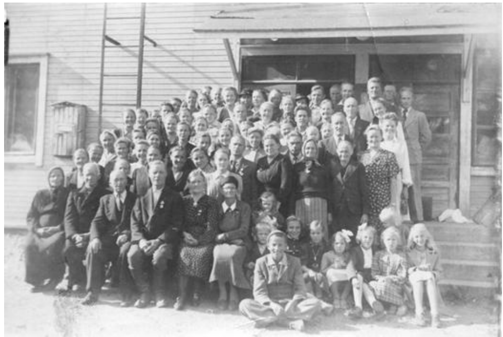
Seurakuntakuva Ollinlinnan edustalta.

Ensimmäiset evankelioimiskokouksensa Luukkanen ja Lehtoluoto pitivät kaupungintalolla, jota he vuokrasivat adventistien käyttöön. He järjestivät siellä vain kolme kokousta, sillä kaupungin virkamiehet estivät heidän salinkäyttönsä. Adventistien seuraava kokoontumispaikka oli Pielisensuun puolella, Niinivaarantiellä Ollinlinnassa, missä he kokoontuivat lauantaisin eli sapattina. Ollinlinna oli Pielisensuun suojeluskuntatalo, jonka salissa eri tahot järjestivät erilaista ohjelmaa tanssiaisista pyhäkouluihin. Salin lisäksi tiloihin kuului keittiö. Lisäksi alakerrassa oli kauppa. Ollinlinnassa oli kolme kerrosta, keski- ja yläkerroksissa oli vuokrahuoneita. Ollinlinna oli monien eri ryhmien käytössä ja myös adventistit saivat vuokrata tilaa tarpeen mukaan. Ensimmäisessä kastejuhlassa keväällä 1947 adventistit kastoivat 59 henkeä. 38