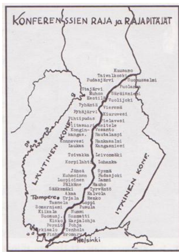
Suomen adventtikirkko jakautui Itä-Suomen ja Länsi-Suomen konferensseihin eli piirikuntiin 1.1.1947.

Adventismi oli dualistinen liike, jossa politiikka ja uskonto kuuluivat eri tasoihin. Poliittista ja uskonnollista johtajuutta ei saanut yhdistää toisiinsa, mutta yhteiskunnallinen lainsäädäntö ei saanut olla ristiriidassa Jumalan lain kanssa. Adventistit eivät toimineet politiikassa eivätkä ottaneet kantaa poliittis-yhteiskunnallisiin kysymyksiin. He olivat kiinnostuneita poliittis-yhteiskunnallisista tapahtumista, mutta vain siksi, että adventismin opilliset lähtökohdat edellyttivät valmiutta ”aikain merkkien” seurantaan. Satunnaisen tarkastelun kohteeksi saatettiin ottaa esimerkiksi kansainvälisen rauhanliikkeen pyrkimykset tai liikennevälineiden nopea kehitys. Kommentoinnin kohteeksi pääsivät lähinnä vain uskonnolliset kysymykset, koska todellisuutta tarkkailtiin vain Raamatun profetioiden täyttymystä silmällä pitäen. Adventismin sopeutuminen suomalaiseen yhteiskuntaan oli hidasta, koska se oli sulkeutunut uskonyhteisö. 26