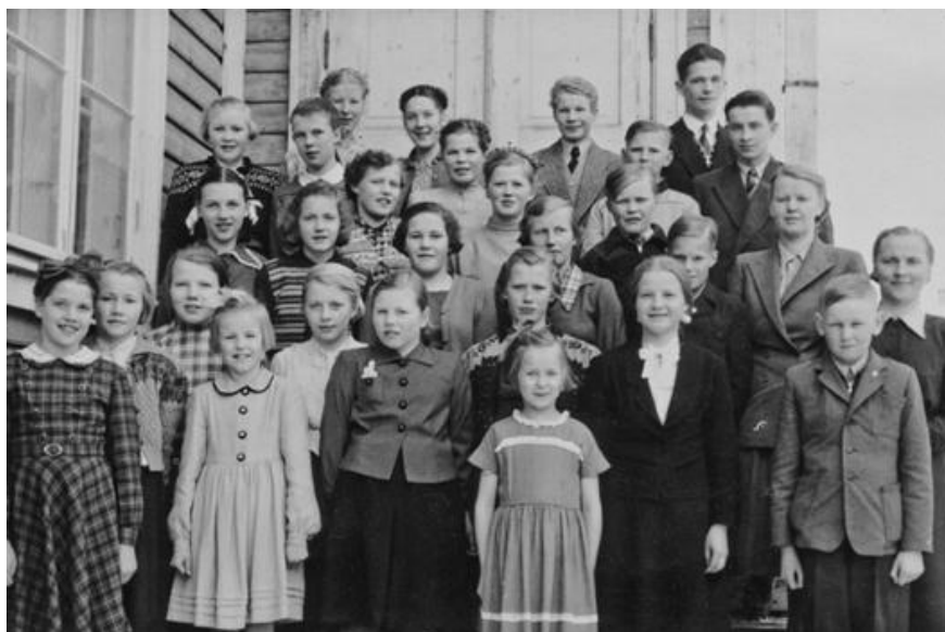
Nuorten kerho 25.3.1953.