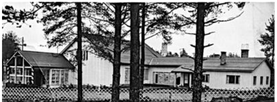
Vastavalmistunut Joensuun adventtikirkko sisäpihalta kuvattuna vuonna 1950. Vasemmalla eteinen ja kirkkosali, oikealla sivutilat sekä asunnot seurakunnan virkailijoille.