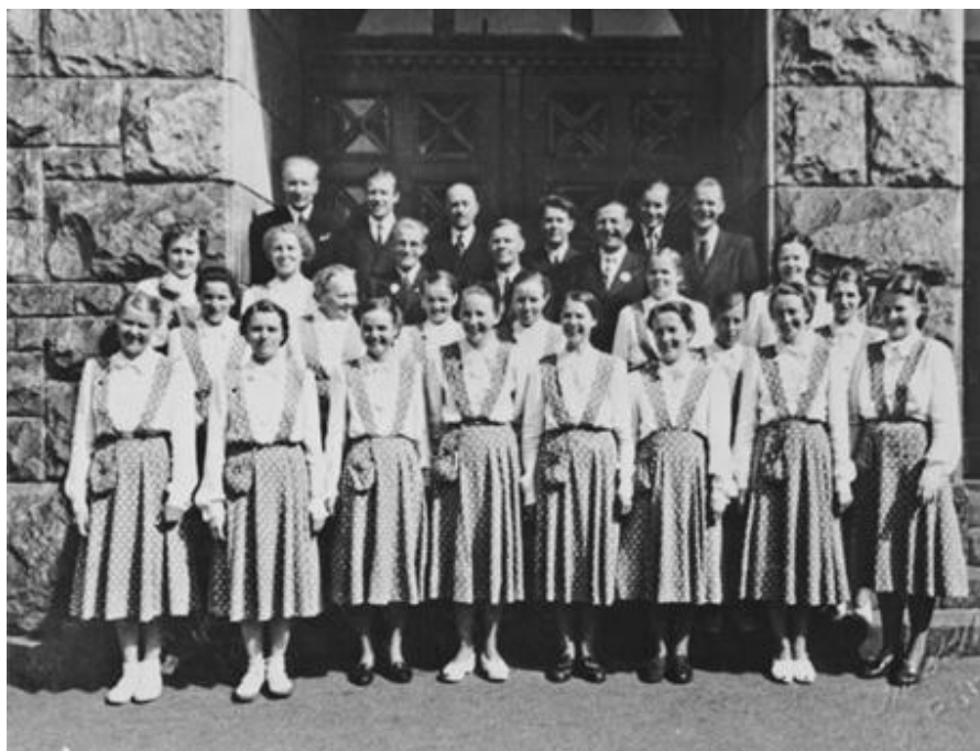
Joensuun kuoro esiintyi adventtikirkon vuosijuhlilla Helsingissä 15–20.6.1949 uusissa laulupuvuissaan.

Urkuharmoni hankittiin seurakunnan kolehtivaroilla vuonna 1948. Se maksoi lähes satatuhatta markkaa. Harmoni oli kallis soitin ja seurakuntalaiset olivat sen ostamisesta ylpeitä. Soitin elävöitti sapattikokousten musiikkia. 64