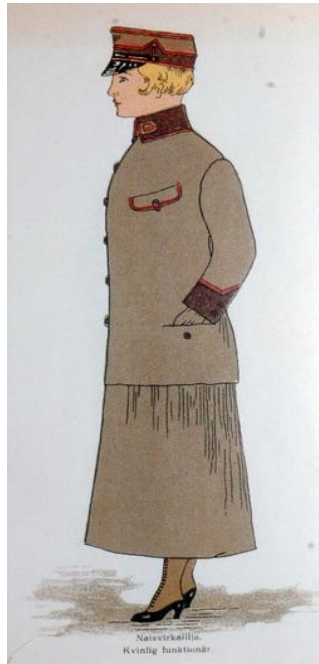
Kuva 4: Naisvirkaailijan puku itsenäistymisen jälkeen.

Suomen itsenäistymisen jälkeen haluttiin päästä eroon venäläismallisesta mustasta verasta tehdystä virkapuvusta. Uusi virkapukumalli oli muunnos jääkäriunivormusta pystykaulusineen ja materiaalina oli vihreänharmaa villakangas. Puvun kuosi oli muuttunut yhä sotilaallisemmaksi ja siihen oltiin yleisesti tyytymättömiä. Kuitenkin vasta vuonna 1929 siirryttiin pukumateriaalissa tummansiniseen villakankaaseen. Takki oli siviilikuosinen, avokauluksinen ja napit olivat kahdessa rivissä. Naisten hameen pituus nousi puolisääreen. 150