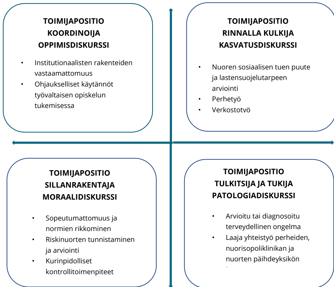
Kuvio 2. Sosiaalityöntekijän toimijapositiot ja diskursiiviset toimintakontekstit opiskelijahuollossa (Perttula 2021, 92.)

Opiskelijahuollon kuraattorina aiemmin toiminut Rauno Perttula on väitöskirjassaan (2015) jäsentänyt tutkimustulosten pohjalta yllä olevan kuvion 2. mukaisesti opiskelijahuollon sosiaalityön neljää eri toimijapositioita ja diskursiivista toimijakontekstia. Toimijapositiot muuttuvat ja ovat myös päällekkäisiä, taustalla vaikuttavat yhteistyöverkostojen rakenne, asiakassuhteet ja menetelmät ammatillisesti. Perttulan nuorten aikuisten parissa tekemässä sosiaalityön tutkimuksessa (2021) on hyödynnetty samaa jäsenystä. (Perttula 2021, 92.)